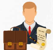
Habla con un abogado