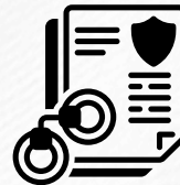
Solicitar una orden judicial

Nota: Si los funcionarios de inmigración toman artículos de su casa, mantenga un registro de lo que se llevaron y solicite un recibo por los artículos.